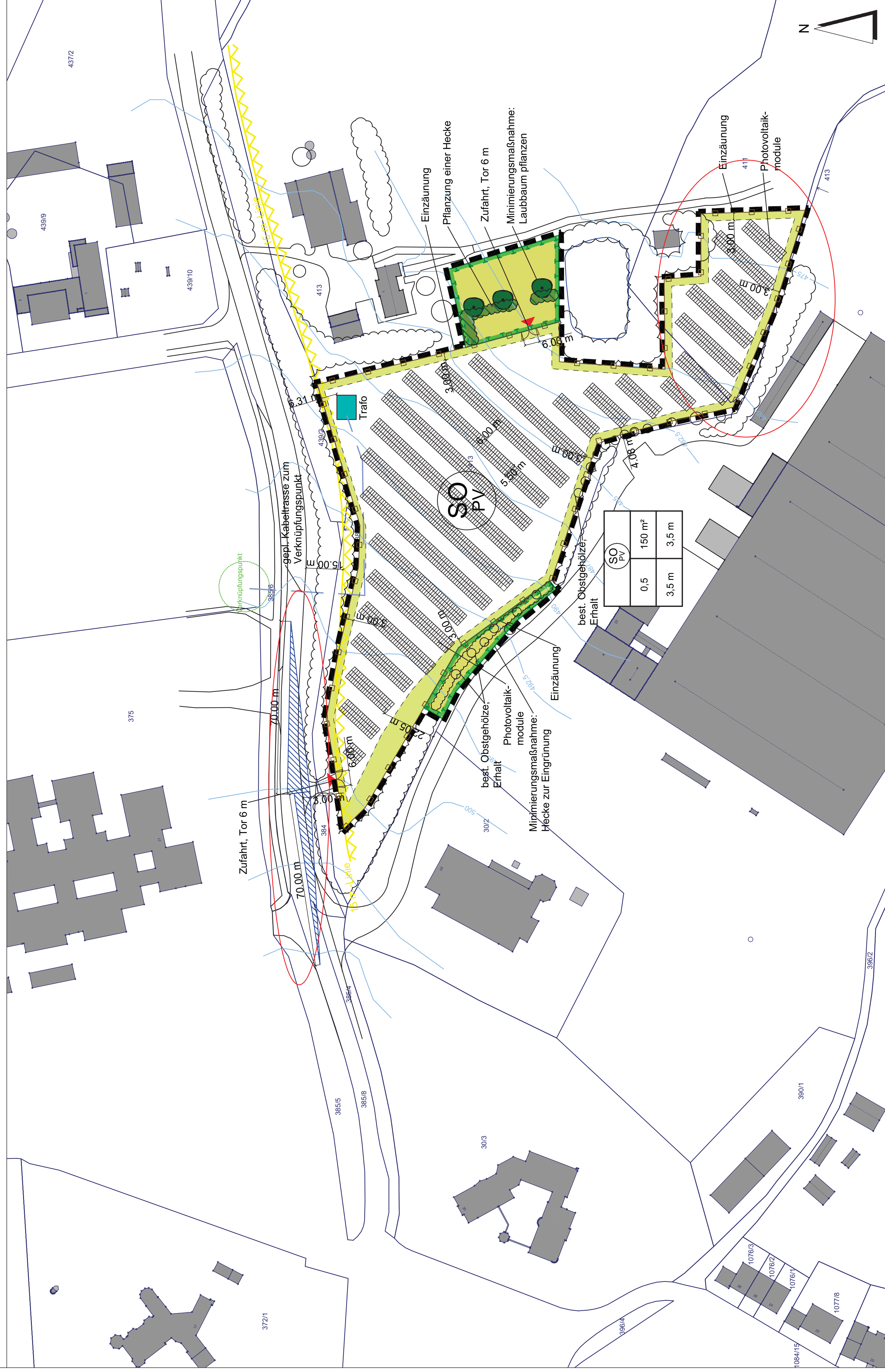
Vorhaben- und Erschließungsplan M 1:1000